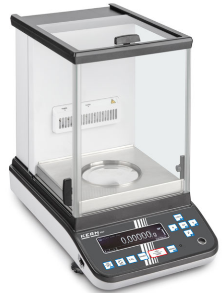
1 ABP 100-5DM mit optionalem Ionisator

1 NEU: Extrem schneller Ionisationsvorgang, dank der neuesten Generation der Ionisationstechnologie zum Neutralisieren elektrostatischer Aufladung zum Festeinbau in die Analysenwaage. Besonders bequeme Handhabung, da kein separates Gerät mehr nötig ist. Einfach durch Tastendruck das Ionisationsgebläse hinzuschalten. Passend für alle Modelle dieser Serie, siehe Zubehör rechts